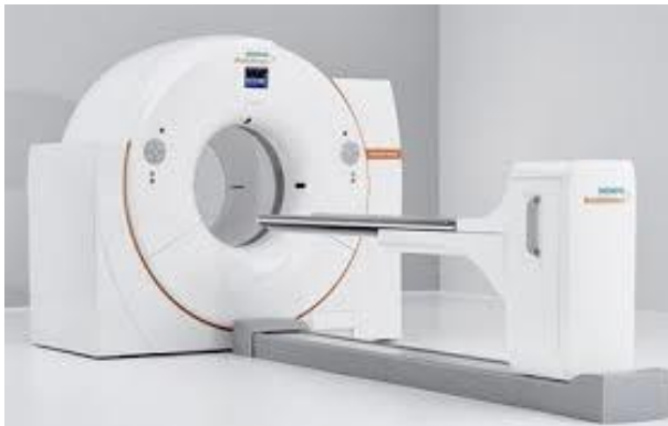
Figuur 2a PET CT apparaat