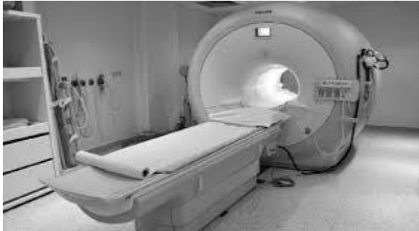
Figuur 1a MRI apparaat

De module Medische Beeldvorming is onlangs ge-update op basis van feedback, opgehaald tijdens de APK van de module.