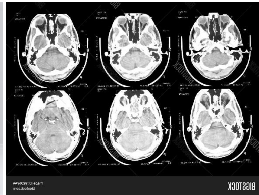
Figuur 2b CT scan