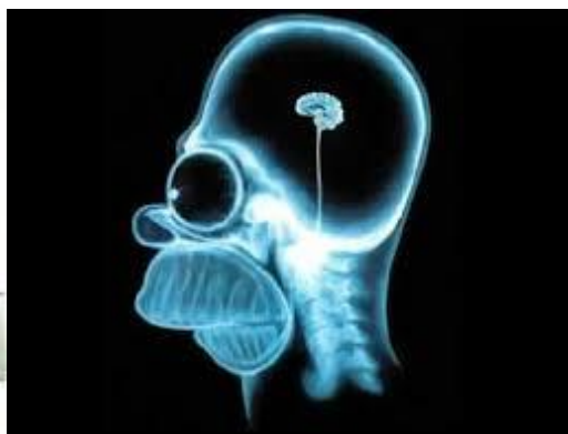
Figuur 4 Afbeelding Röntgenstraling

Bij het updaten is er besloten tot de volgende focus: